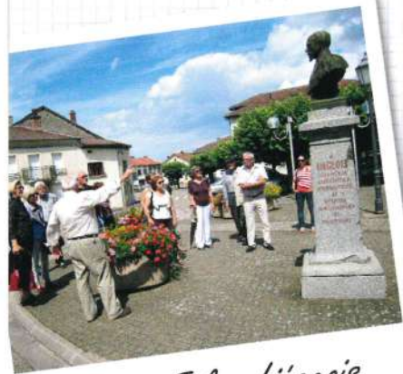
Place Jules Liégeois