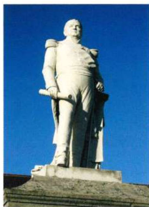
Statue du Maréchal Gérard