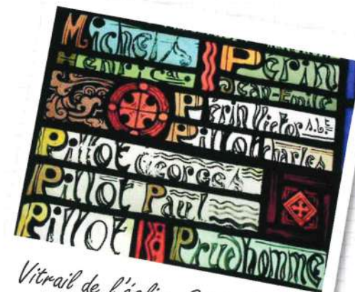
Vitrail de l'église Saint-Maurice