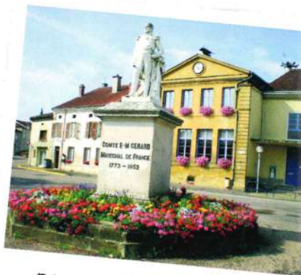
Place du Maréchal Gérard

Son nom est inscrit sur l'arc de Triomphe de Paris.