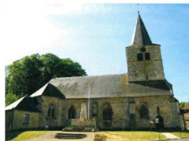
L'église Saint-Maurice de Damvillers

La porte qui se détache sur le devant, marque l'entrée de l'ancien cimetière qui entourait l'église jusqu'en 1848. L'auvent placé au-dessus du porche provient d'un ermitage qui était situé sur la route de Dombras au lieu-dit Jossifontaine. Il fut détruit à la Révolution et l'abbé Mandre (1748 - 1825) en récupéra une partie.