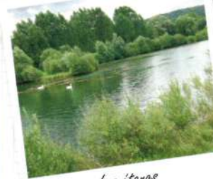
Les étangs des Ballastières

Traversez la Rue Carnot pour prendre en face le chemin des Chênevières . À 200m un chemin sur votre gauche vous mène aux Ballastières où un circuit découverte de la faune et de la flore est à votre disposition, voici le but d'une autre promenade.