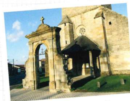
Parvis de l'église Saint-Maurice

A l'extérieur, des pierres tombales provenant de l'ancien cimetière.