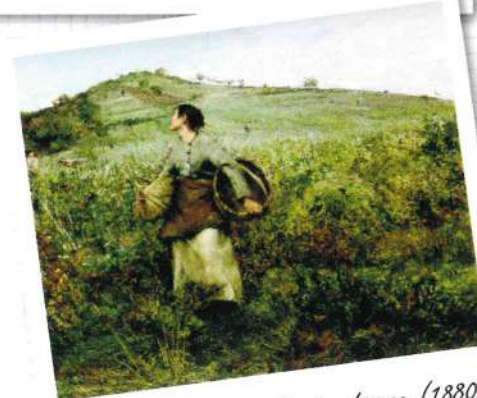
Les vendanges - Jules Bastien-Lepage (1880)

Le circuit «Sur les pas de Jules Bastien-Lepage» vous fait découvrir Damvillers à l'époque du peintre. Sur ce parcours sont présentées les reproductions de ses plus beaux tableaux.