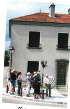
Maison natale de Jules Bastien-Lepage

Face à vous, la Place du Maréchal Gérard*(6) , l' Ecole Primaire et la salle des Fêtes (7) qui a été construite sur l'emplacement de l'ancien marché couvert.