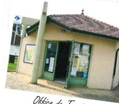
Office de Tourisme de Damvillers

Prenez la rue de la Porte Basse, dirigez-vous vers la Place de la Déesse (5) . Là, une statue en bronze de la déesse des moissons décore une très ancienne fontaine restaurée.